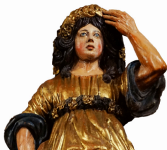
Terme - Église de Pouzac